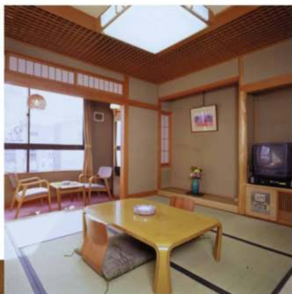
▲ 客室 Guest Room