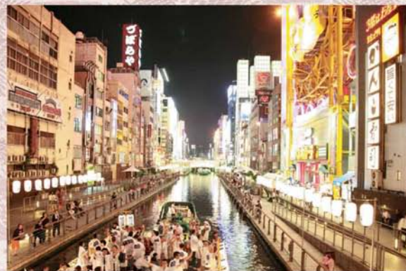
道頓堀川水辺遊歩道「とんぼりリバーウォーク」