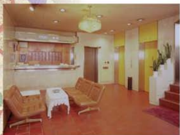
▲ フロント・ロビー Front · Lobby

なにわ風情の旅路の宿は 和の寛ろぎに出で湯のぬくもり 今日の思い出語りつつ 心休めて明日への眠り