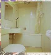
(浴室バスタイレ付) Private Bath & Toilet