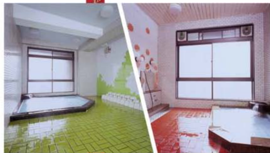
▲ 大浴場 Common Bath